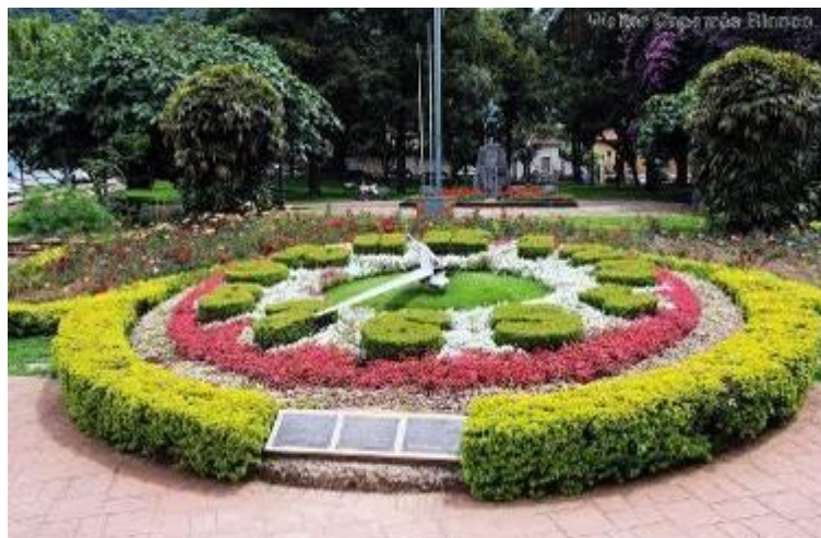
Foto Relógio Floral do município de Poços de Caldas / Minas Gerais